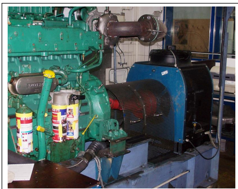
Motorenprüfstand MT 300 für VOLVO Diesel